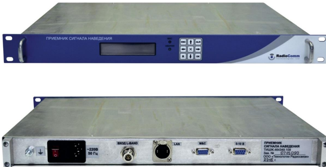
Рисунок 1.2.3.1 – Внешний вид приемника наведения ПСН

ЦПСН построен по принципу Software-defined radio (SDR) является приемником гетеродинного типа с нулевой промежуточной частотой (Zero-IF) и квадратурными каналами.