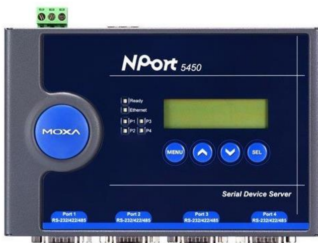
Рисунок 1.2.5.1 - Внешний вид асинхронного сервера MOXA NPort 5450

Асинхронный сервер MOXA NPort 5450 сконструирован в виде блока для установки в стандартный 19 дюймовый телекоммуникационный шкаф, внешний вид которого приведен на рисунке 1.2.5.1.