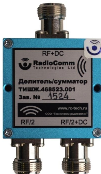
Рисунок 1.2.6.1 – Делитель/сумматор ДС 1/2 ТИШЖ.468523.001

Внешний вид делителя/сумматора ДС 1/2 ТИШЖ.468523.001 представлен на рисунке 1.2.6.1.