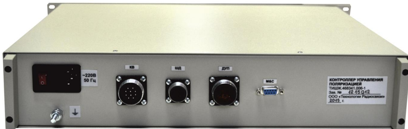
Рисунок 1.2.4.1 – Внешний вид КУП со стороны лицевой и задней панелей

Основные технические характеристики (параметры) КУП приведены в таблице 1.2.4.1.