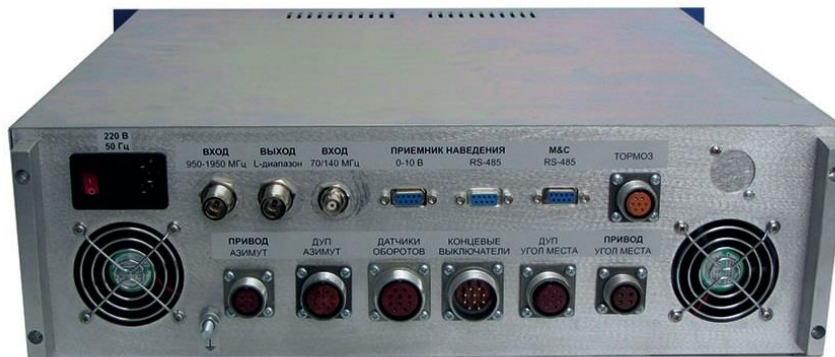
Рисунок 1.2.2.2 - Внешний вид задней панели БУА 3700

На лицевой панели БУА расположены органы местного управления, обеспечивающие режим местного управления путём нажатия на кнопки управления движения (Плюс Аз, Минус Аз, Плюс Ум, Минус Ум) и контроля положения антенны.