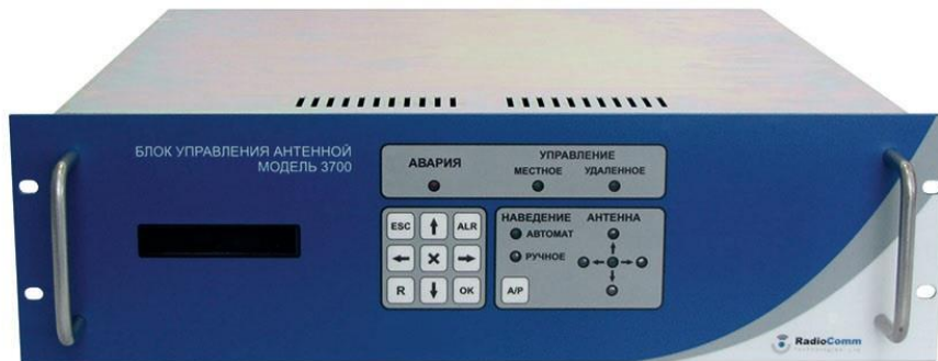
Рисунок 1.2.2.1 - Внешний вид лицевой панели БУА 3700

Внешний вид лицевой панели БУА 3700 приведен на рисунке 1.2.2.1, задней панели – на рисунке 1.2.2.2.