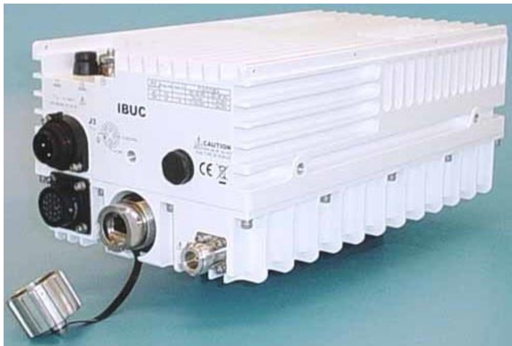
Рисунок 1.2.8.1 – Внешний вид передатчика IBUC R IBR137145-0NA080WW

Внешний вид передатчика IBUC R IBR137145-0NA080WW представлен на рисунке 1.2.8.1.