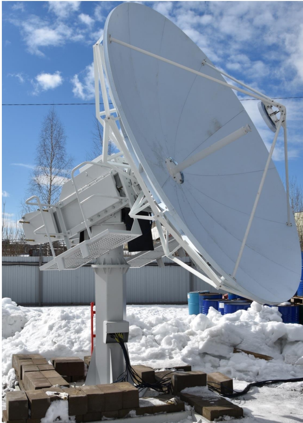
Рисунок 1.2 - Внешний вид АС 3,7 м Ku-диапазона

На антенной системе размещены элементы, взаимодействующие с устройствами системы наведения антенны, поэтому они функционально включаются в состав СНА. К ним относятся: